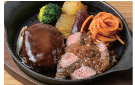
ハンバーグ&カットステーキ Hamburger Steak & Cut Beef Steak 2800