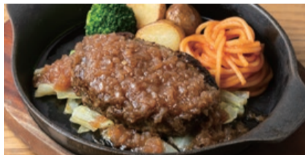
ハンバーグ 和風オニオンソース Japanese Style Hamburg Steak