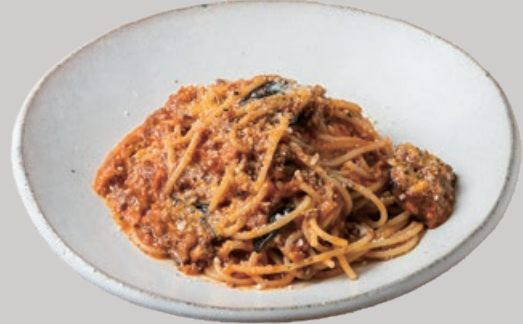
淡路牛とナスのボロネーゼ スパゲッティ 1750 Awaji Beef & Eggplant Bolognese Spaghetti