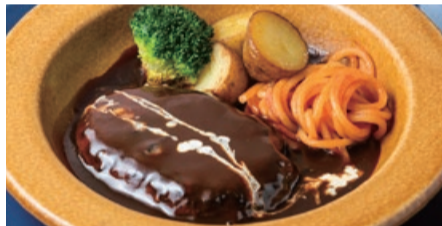
ハンバーグデミグラスソース Demi Glace Hamburg Steak