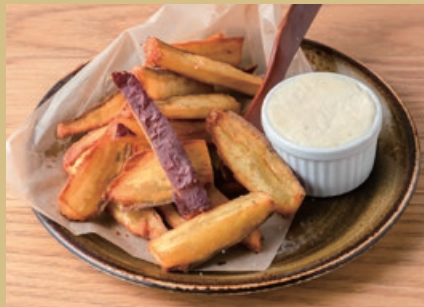
シルクスイートのハニーバター 900 Silk Sweet Honey Butter