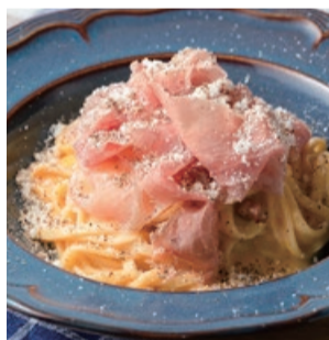
★名古屋コーチン卵と 削りたて生ハムのカルボナーラ タリオリーニ Carbonara Tagliolini with Nagoya Cochin Egg & Freshly Shaved Raw Ham (+200)