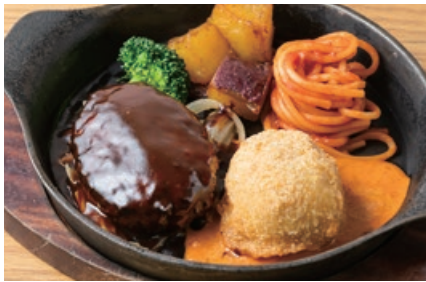
ハンバーグ&紅ズワイガニの カニクリームコロッケ Hamburger Steak & Crab Cream Croquette 1950