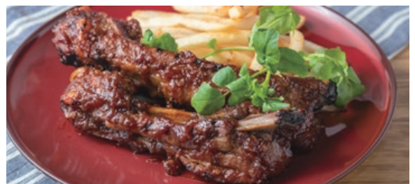
愛知県産豚スペアリブのグリル BBQソース 2200 Grilled Aichi Pork Spare Ribs with BBQ Sauce