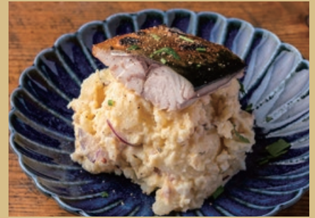
スモーク鯖のポテトサラダ 750 Smoked Mackerel Potato Salad