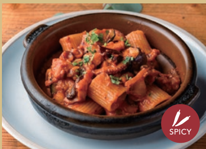
蛸と茄子のアラビアータ 900 メツエマニケ Octopus and Eggplant Arrabbiata Mezze Maniche