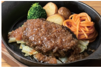
ハンバーグ 和風オニオンソース Japanese Style Hamburg Steak 1700