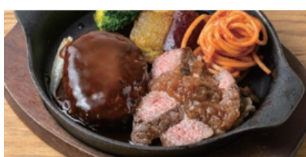
ハンバーグ&カットステーキ (+1150) Hamburger Steak & Cut Beef Steak