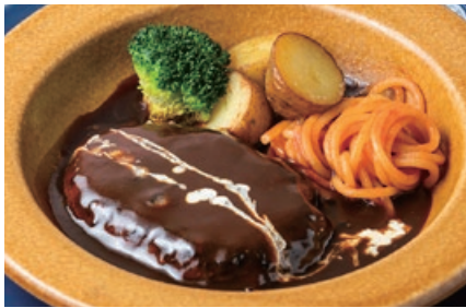
ハンバーグ デミグラスソース Demi Glace Hamburg Steak 1700