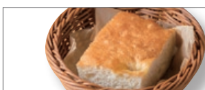
フォカッチャ 1CUT 120 もちり、ふわふわのお食事パン