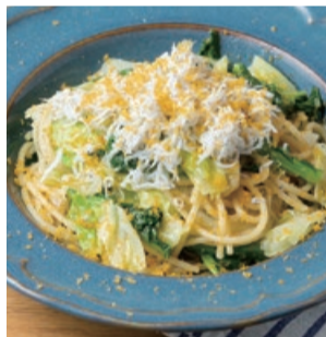
愛知県産しらすと 春キャベツ、からすみの スパゲッティ Spaghetti with Aichi Prefecture whitebait, Cabbage, & Bottarga