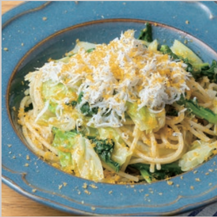
愛知県産しらすと 春キャベツ、からすみの スパゲッティ 1800 Spaghetti with Aichi Prefecture whitebait, Cabbage, & Bottarga