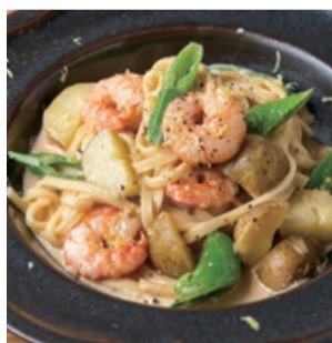
★天然海老とスナップエンドウ、 新じゃがいもの レモンクリームソース タリオリーニ Taliolini with Wild Shrimp, Snap Peas, & Potatoes in Lemon Cream sauce (+300)