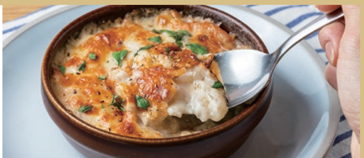
桜えびと天然海老、アスパラの マカロニグラタン 980 Sakura Shrimp and Wild Shrimp, Asparagus Macaroni Gratin