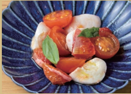
季節のフルーツと ミニトマトのカプレーゼ 800 Caprese with Fruits and Mini Tomatoes