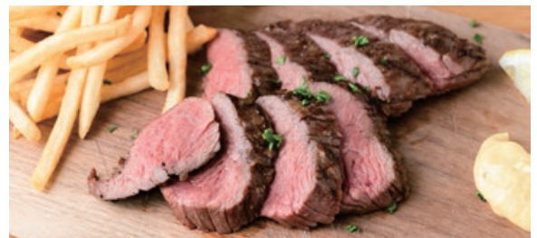
オーストラリア産ステーキフリット 180g 2800 Australia Beef Steak Fritters