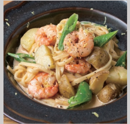
★ 天然海老とスナップエンドウ、1950 新じゃがいもの レモンクリームソース タリオリーニ Taliolini with Wild Shrimp, Snap Peas, & Potatoes in Lemon Cream sauce