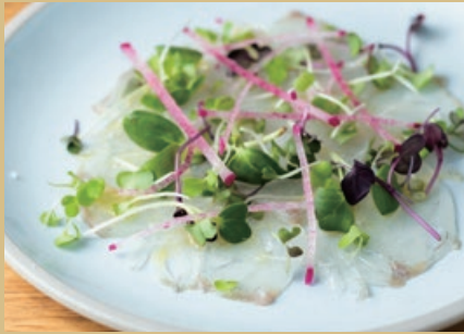
本日のカルパッチョ 750 Today's Carpaccio