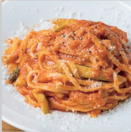
★ 奥三河鶏のスモークと アスパラのトマトソース タリオリーニ 1850 Smoked Okumikawa Chicken & Asparagus with Tomato sauce Tagliolini