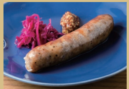
九州産霧島黒豚ソーセージ 900 Kirishima Kurobuta Pork sausage