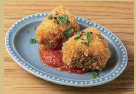
カマンベールチーズのフリット 650 Camembert Cheese Fritters