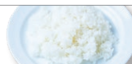
単品ライス 200 お好きなメニューと一緒に。