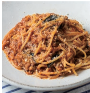
淡路牛と ナスのボロネーゼ スパゲッティ Awaji Beef & Eggplant Bolognese Spaghetti