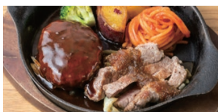
ハンバーグ&優味豚のロースト (+800) ジンジャーソース Hamburger Steak & Grilled YUMI Pork