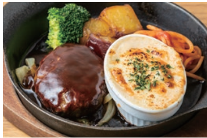
ハンバーグ &天然海老のグラタン Hamburger Steak & Shrimp Gratin 2300