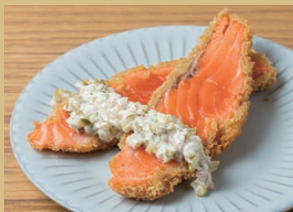
愛知県産絹姫 スモークサーモンのレアカツ 880 Raw Cutlets of Aichi Kimuhime Smoked Salmon