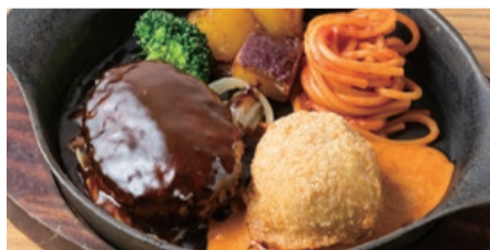
ハンバーグ& 紅ズワイガニのカニクリームコロッケ Hamburger Steak & Crab Cream Croquette (+300)