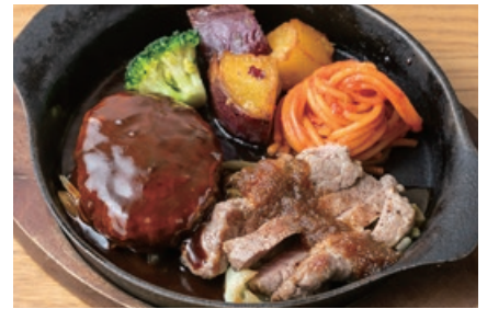
ハンバーグ&優味豚のロースト ジンジャーソース Hamburger Steak & Grilled YUMI Pork 2400