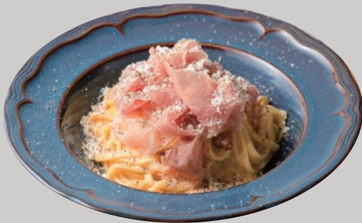
★ 名古屋コーチン卵と削りたて生ハムの カルボナーラ タリオリーニ 1900 Carbonara Tagliolini with Nagoya Cochin Egg & Freshly Shaved Raw Ham