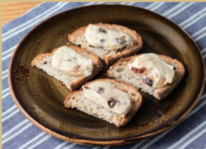
ラムレーズンバターのブルスケッタ 800 Bruschetta with Rum Raisin Butter