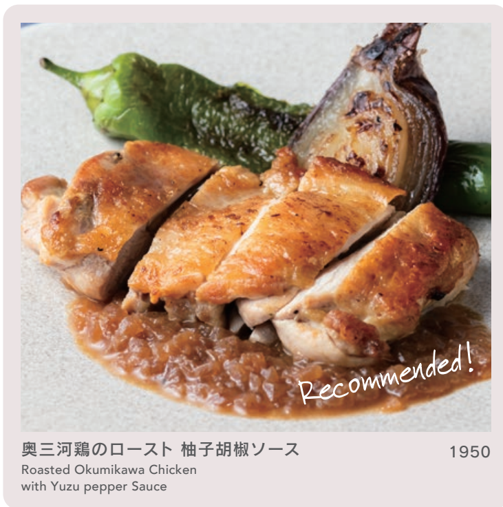
奥三河鶏のロースト 柚子胡椒ソース Roasted Okumikawa Chicken with Yuzu pepper Sauce 1950