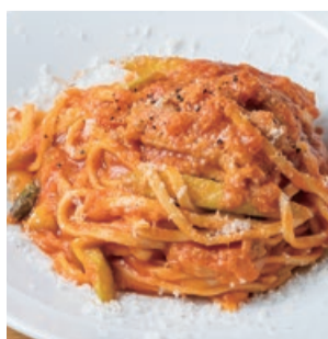
★奥三河鶏のスモークと アスパラのトマトソース タリオリーニ Smoked Okumikawa Chicken & Asparagus with Tomato sauce Tagliolini (+300)