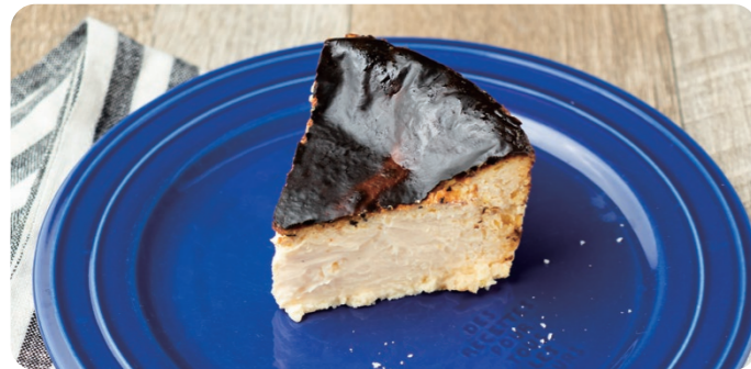
バスクチーズケーキ BASQUE CHEESECAKE 830