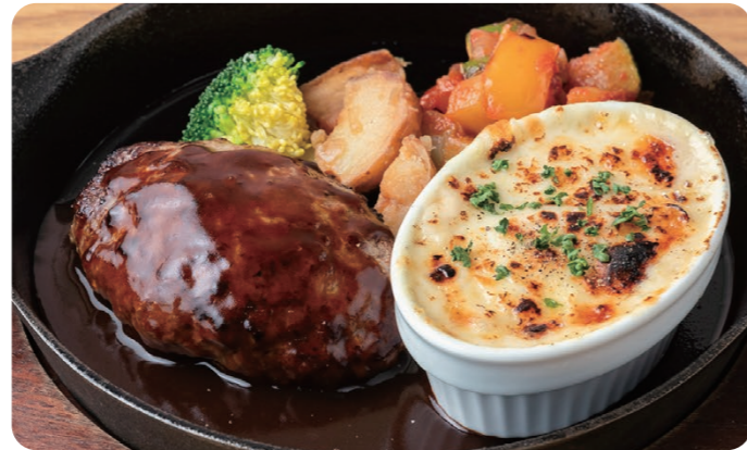
ハンバーグ&ホタテグラタン 2300 HAMBURGER STEAK & SCALLOP GRATIN Bread or Rice [パン or ライス付] アツアツのチーズとろけるグラタンとハンバーグの人気プレート。