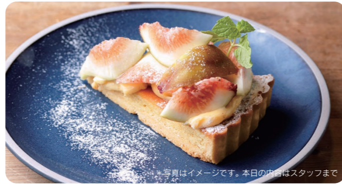
季節のフルーツタルト SEASONAL FRUITS TART 990