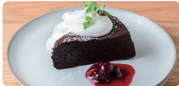
ガトーショコラ GATEAU AU CHOCOLAT 940