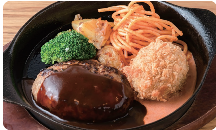
ハンバーグ&紅ズワイガニのカニクリームコロッケ 1950 HAMBURGER STEAK & CRAB CREAM CROQUETTE Bread or Rice [パン or ライス付] 濃厚、クリーミーなカニクリームコロッケつき。