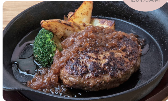
ハンバーグ 和風オニオンソース 1650 JAPANESE STYLE HAMBURG STEAK Bread or Rice [パン or ライス付] 荒目の玉ねぎが極め手! 赤ワインも使った深みのあるソース。