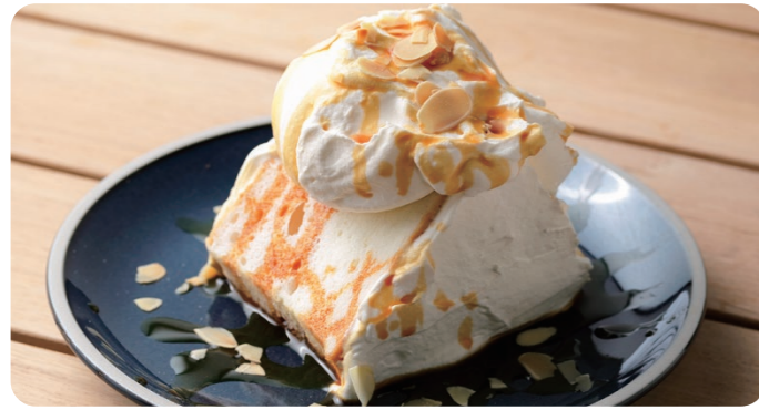
エンゼルフードケーキ バニラキャラメル ANGEL FOOD CAKE 760