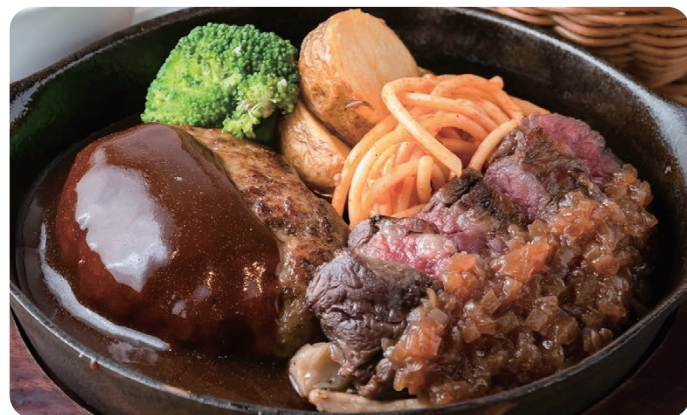
ハンバーグ&カットステーキ 2800 HAMBURGER STEAK & CUT BEEF STEAK Bread or Rice [パン or ライス付] ジューシーなカットステーキを特製のオニオンソースで。