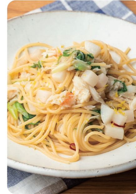
ズワイガニと九条ねぎの 2200 スパゲッティ 柚子の香り SPAGHETTI WITH SNOW CRAB & KUJO LEEK WITH YUZU +Bread [パン付]