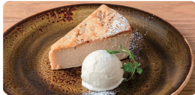
エスプレッソチーズケーキ ESPRESSO CHEESE CAKE 880