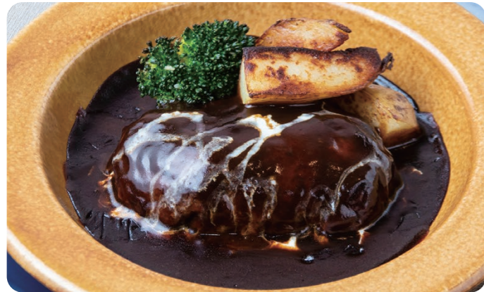
ハンバーグ デミグラスソース 1650 DEMI GLACE HAMBURG STEAK Bread or Rice [パン or ライス付] 甘味とコクのあるデミグラスソースで仕上げたイチオシ!

LUNCH SET'S BREAD, RICE FREE REFILLS ランチセットの パン・ライス おかわり無料!