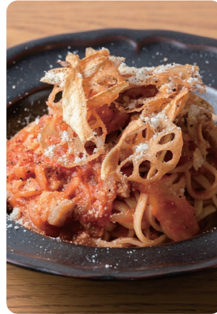
★ 知多ハッピーポークベーコンと 1650 根菜のアマトリチャーナタリオリニ TAGLIOLINI AMATRICIANA WITH PORK BACON & ROOT VEGETABLES +Bread [パン付]