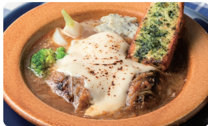
オニオングラタンハンバーグ 2200 ONION GRATIN HAMBURGER STEAK Bread or Rice [パン or ライス付] 玉ねぎの甘味をじっくり煮込んで引き出したソースと、とろりチーズ。