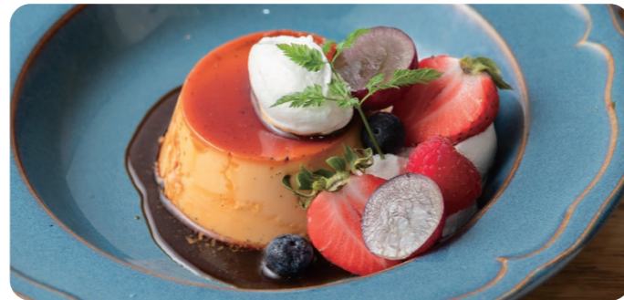
プリンアラモード PURINE À LA MODE 1200